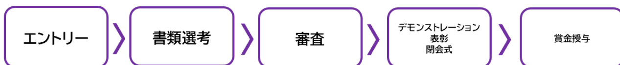
<図:コンテストの流れ>

11月につくば市で開催予定です。観客に向けてデモンストレーションをしていただきます。